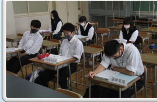
専門委員長会議(7月7日)