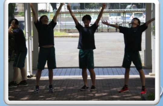
ダンス練習風景(8月5日)

多賀高校は、夏休みは課外にも参加できるように部活動の時間を設定しています。勉強に部活動に充実した夏休みを送れます。プレ松苑祭のためのダンス練習も日陰で頑張っているグループが多く見られました。まさしく青春ですね！