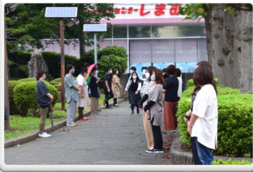
PTA合同登校指導(7月6日)

今年度は夏休みまでコロナ禍の中でも何とかペースをつかって生活できていましたが、夏休み後半に、県独自の非常事態宣言、後を追うように国が緊急事態宣言を茨城県にも発出するに至りました。登校禁止になるまでの多賀高生の元気に活動する姿をお届けします。