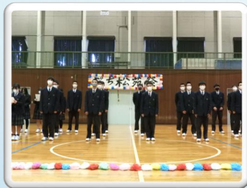
プチ松苑祭合唱コンクール(3日)