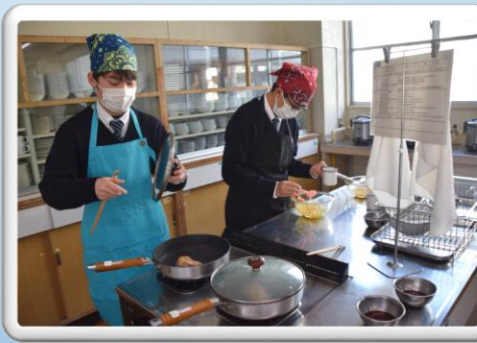
家庭科調理実習(22日)