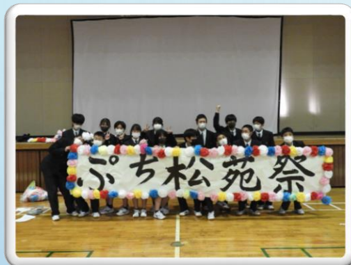
1年生プチ松苑祭(3日)

国のまん延防止等重点措置地域に茨城県がなっていました。期間は、1月27日から2月20日までの25日間でしたが、3月6日まで延長されてしまいました。2月21日から部活動は再開しましたが、大会等は取りやめになったものもありました。可能な限りの感染症対策を行って教育活動を推進しました。