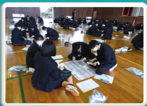
1年生仕事・資格パズルワーク(2日)

令和4年度は新生活様式も浸透し、様々な学校行事が復活しつつあります。 多賀高生の元気に活動する姿をお届けします。