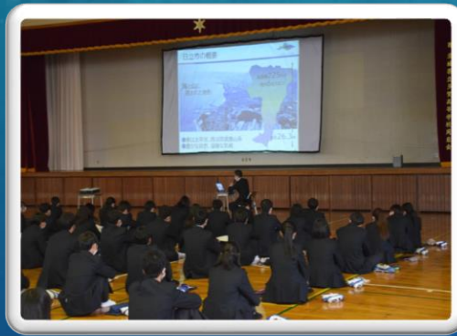
2年生探究学習講演会(16日)