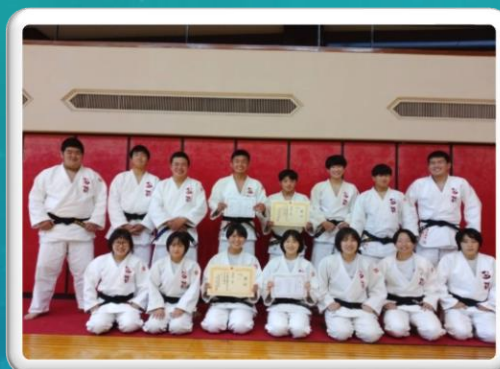
柔道部男女関東大会出場