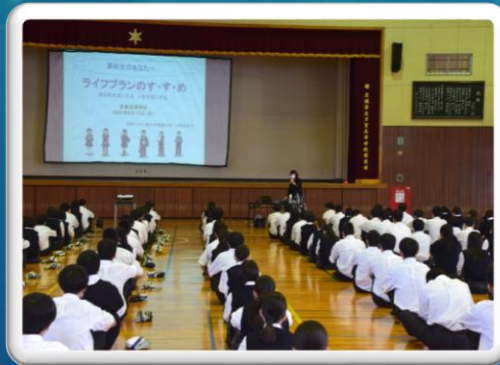
2年生性教育講話(13日)