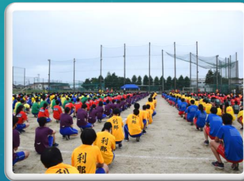
クラスマッチ開会式(8日)