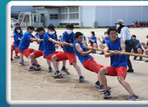
クラスマッチ第2日目(10日)