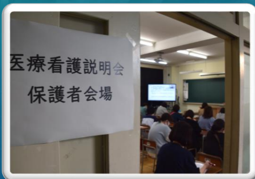
看護医療説明会(10日)