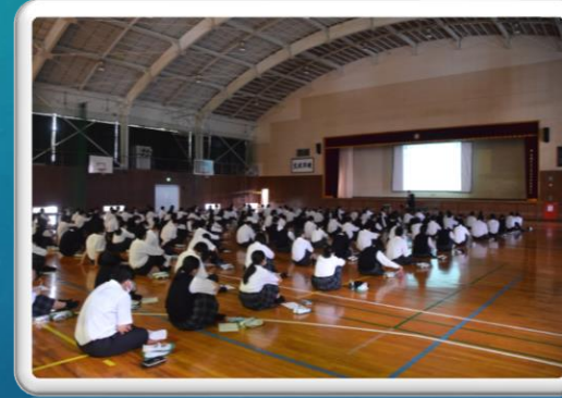
1年生進路講話(6月23日)