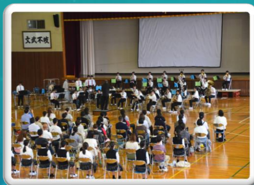
吹奏楽部定期演奏会(6月18日)