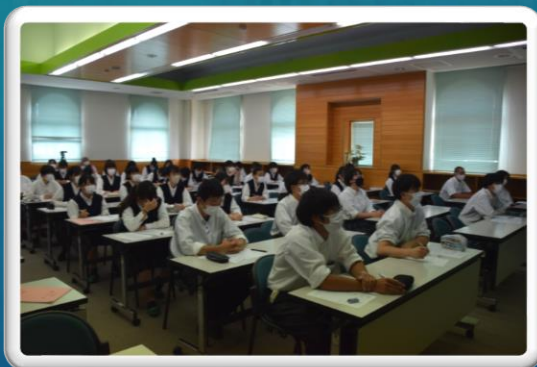
進路ガイダンス2年生(6月27日)