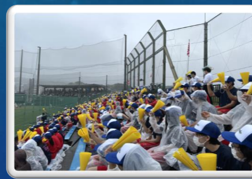
野球応援(対日立一)(14日)

6月は下旬に定期試験もありましたが、関東大会やインターハイ県予選が行われました。本校はほとんどの部活動が地区大会を上位で勝ち抜き県大会に出場しました。インターハイ出場を勝ち取った部はありませんでしたが、高校生活の思い出に残る素晴らしい試合を繰り広げることができたと思います。探究活動も盛んに実施され進路関係の研究も進んで自分の進路について考えるきっかけになっています。2年間行われなかった野球応援も雨が降ってしまいましたが、実施することができました。