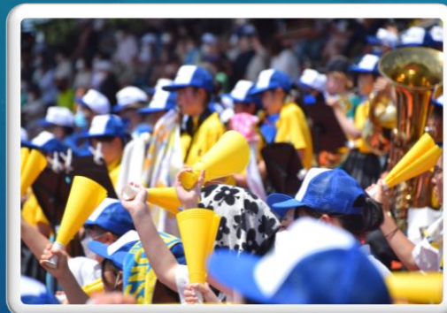
野球応援(対総和工業)(10日)