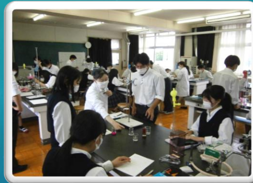
理科実験(科学と人間生活)