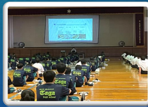
1年生ゲストティーチャー講演会(11日)