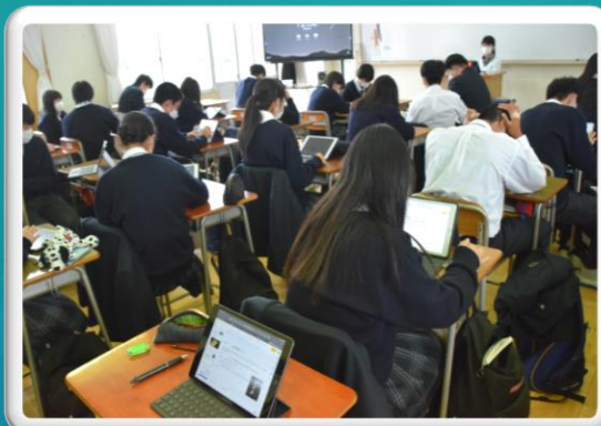
2年生総探平和学習(13日)