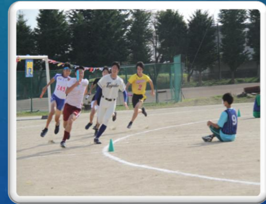
体育祭部対抗リレー(21日)