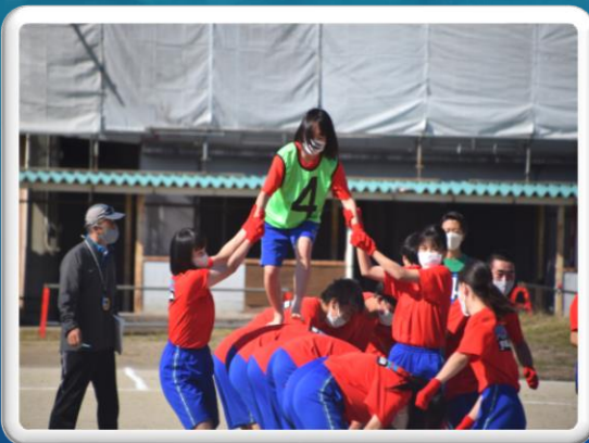
体育祭背中渡り(21日)