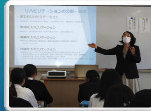
サイエンスアカデミー(20日)