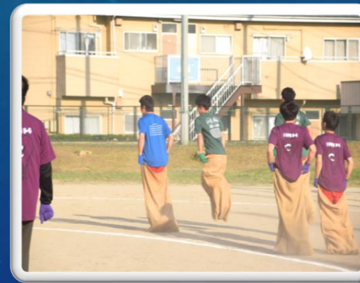
体育祭フレンドリレー(21日)

10月は転機が不安定で、暑い日もあり、急に冷え込んだりと体調管理が大変でした。そんな中でも、定期考査もあり、部活動の公式戦もありと大忙しの初秋でした。3年に1度の体育祭も予行練習は天候の関係でできませんでしたが、体育祭は盛大に実施することができました。体育祭実行委員の方々と生徒会役員の活躍の賜です。