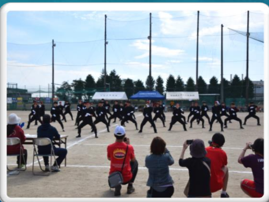
体育祭集団演舞(21日)