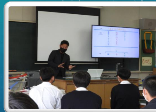
社会人インタビュー(7日)