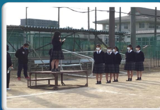
陸上部関東駅伝大会壮行会(10日)