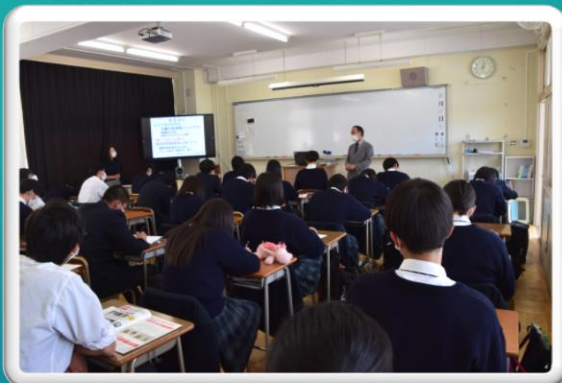
薬物乱用防止教室(10月27日)

令和4年度は新生活様式も浸透し、様々な学校行事が復活しつつあります。多賀高生の元気に活動する姿をお届けします。