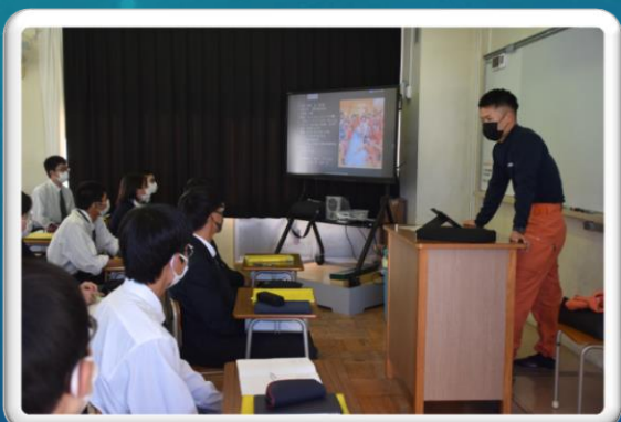
社会人インタビュー(7日)