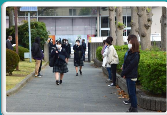
さわやかマナーアップ運動(1日)