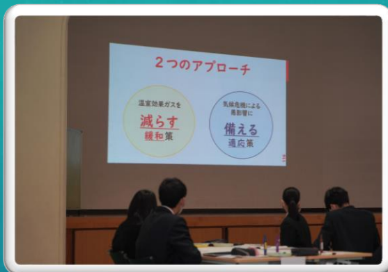
JICA国際交流実体験プログラム(3日)

令和4年度は新生活様式も浸透し、様々な学校行事が復活しつつあります。多賀高生の元気に活動する姿をお届けします。